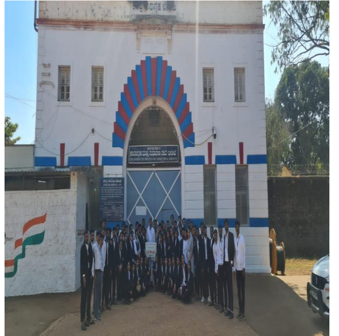
Students, staff and Prison Department officials in front of prison